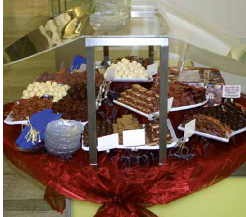
Spuckschutz aus Acryl (nur in der Schweiz lieferbar)

Auch hier kann auf Ihre Wünsche eingegangen werden, damit am Ende ein Produkt entsteht, das exakt Ihren Vorstellungen entspricht.