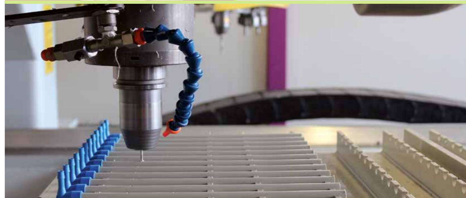
Formfräsen: CNC Maschine im Einsatz