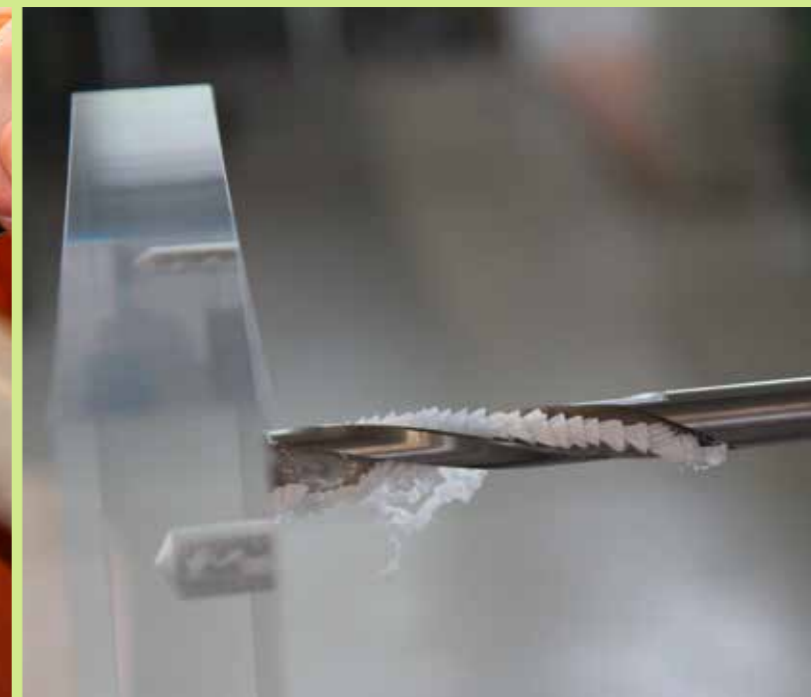
Bohrung an einer transparenten Platte aus PMMA