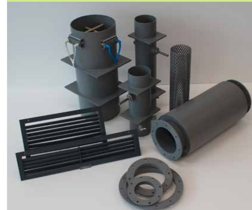
Lüftungsteile aus Polyvinylchlorid (PVC)