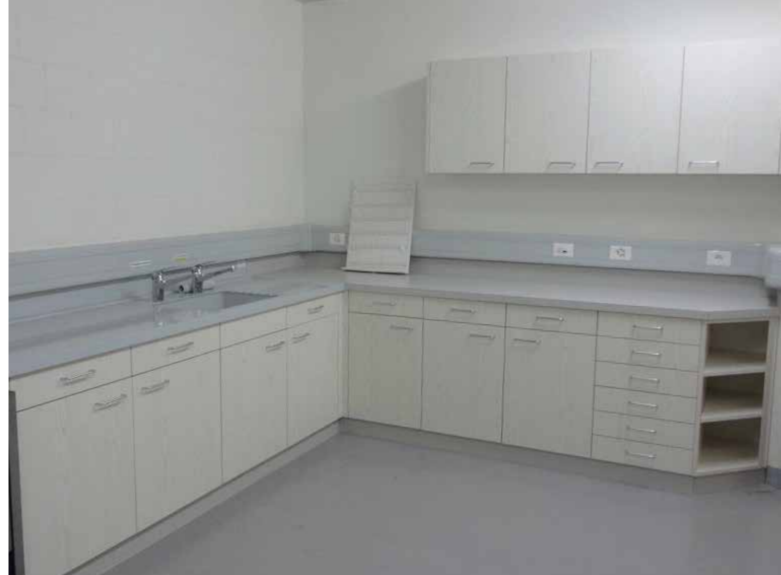
Spültisch aus Polypropylen (PP) mit Holzunterbau