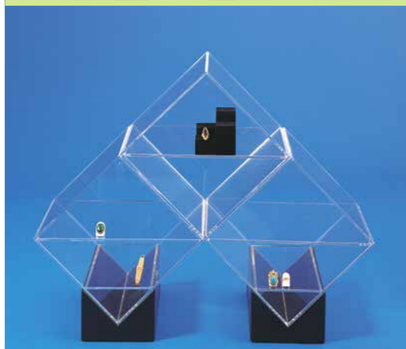
Objekte aus Acryl