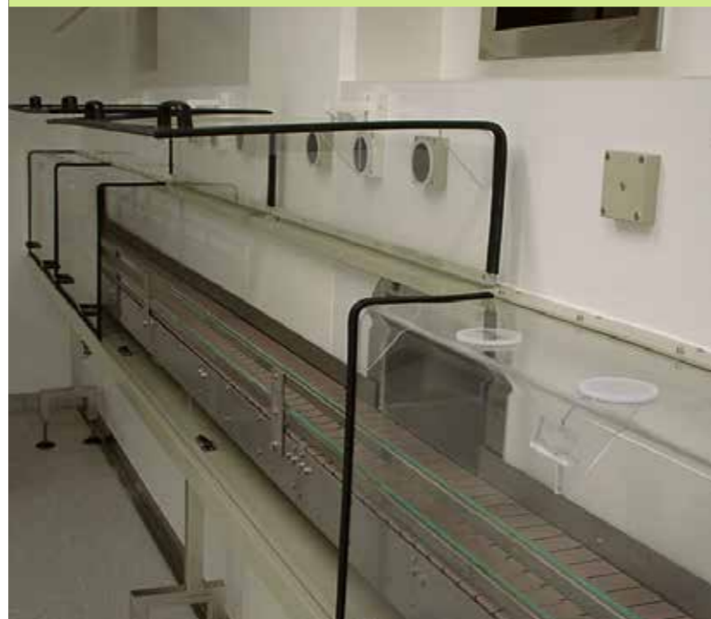
Maschinenabdeckung aus Acryl