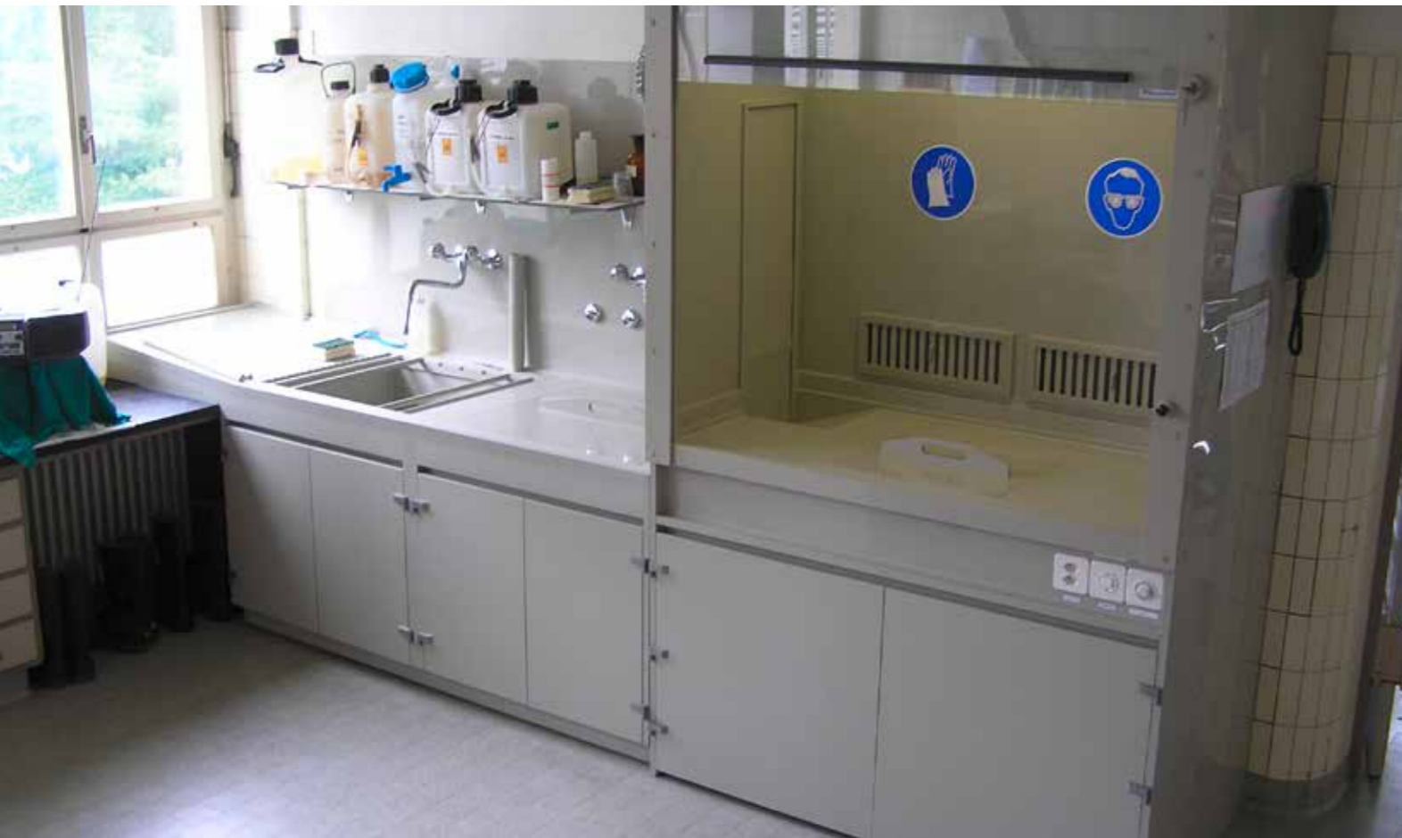
Laborkapelle aus Polypropylen (PP)