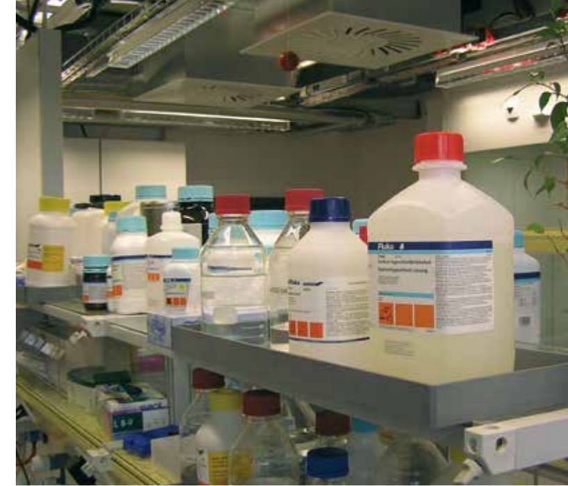
Auffangwannen aus Polypropylen (PP)

Der Einbau dieser Lüftungsgitter erfolgt meist in Kanälen, Wänden, Decken oder Türen. Weitere Lüftungsteile wie Schalldämpfer, Drosselklappen oder Sensorregler bauen wir aus schwer entflammbarem Polypropylen (PPs).