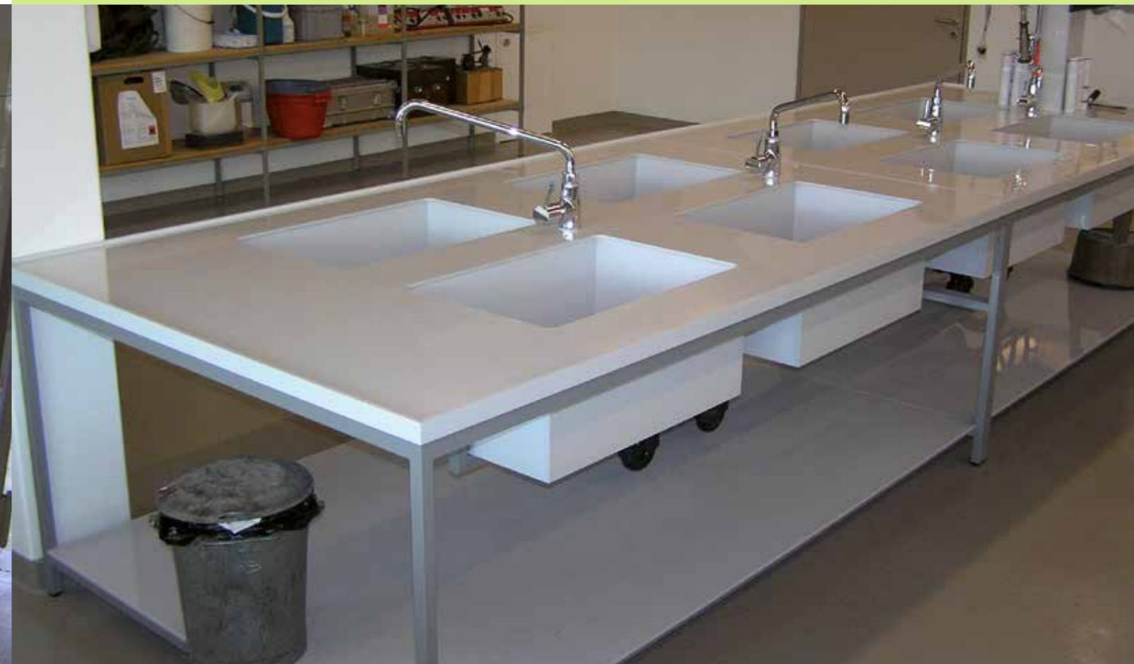
Spültisch aus Polypropylen (PP) mit Metalluntergestell